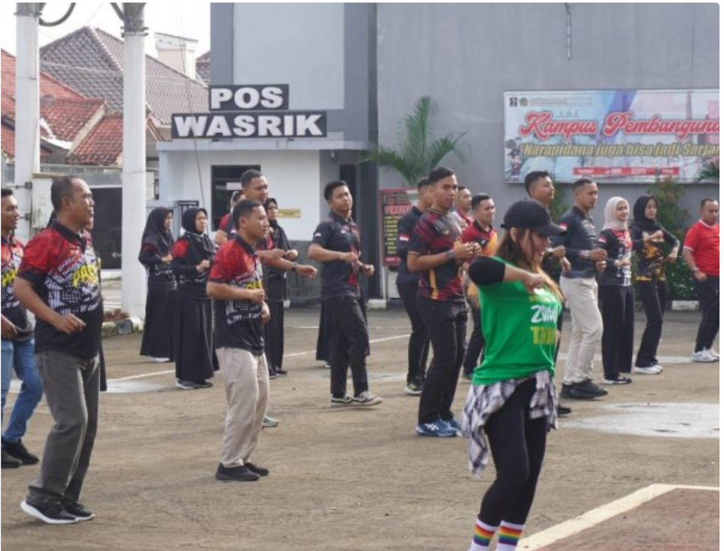
Jaga Kebugaran Tubuh, Pegawai Lapas Kelas IIA Purwokerto Senam Pagi Bersama

PURWOKERTO - Kegiatan senam pagi ini dilaksanakan di halaman gedung utama yang dimulai pukul 07.45 yang dipandu oleh instruktur profesional.